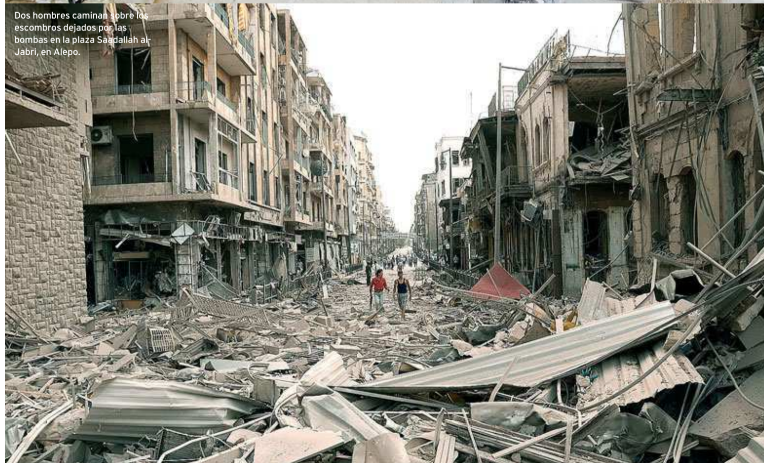
Dos hombres caminan sobre los escombros dejados por las bombas en la plaza Saadallah al Jabri, en Aleppo.