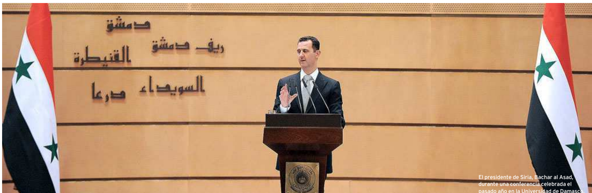
El presidente de Siria, Bashar al Asad, durante una conferencia celebrada el pasado año en la Universidad de Damasco.

visos inmediatos de alcanzar el final. Sometidos a un estado de miedo permanente y a los reveses de una guerra que no cesa de arrojar pruebas de su extrema violencia, se estima que 6,8 millones de personas necesitan ayuda humanitaria, debido a las consecuencias del colapso del sistema de salud, la escasez de alimentos y el destrozado de las infraestructuras que las dotaban de agua y luz. Así, según los datos facilitados por la Organización de las Naciones Unidas (ONU), 4,25 millones de sirios viven como desplazados dentro de su propio país y 1,5 millones más han huido a las poblaciones fronterizas y están ya censados como refugiados o a la espera de serlo, colectivo que en Turquía alcanza los 347.000. Junto a ellos, las 70.000 víctimas mortales registradas desde que comenzaron los enfrentamientos entre el Gobierno y sus opositores, la peor de las lacras que marca el transcurso de esta guerra abierta.