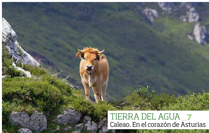
TIERRA DEL AGUA 7 Caleao. En el corazón de Asturias