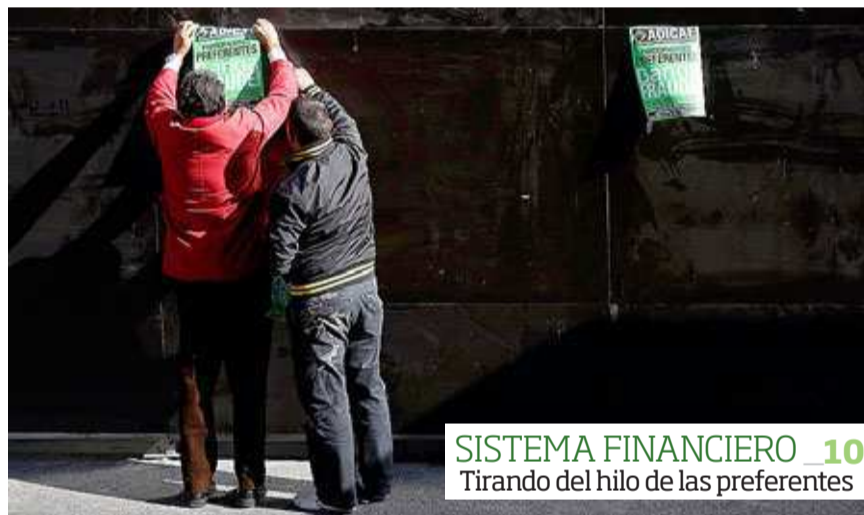
SISTEMA FINANCIERO 10 Tirando del hilo de las preferentes