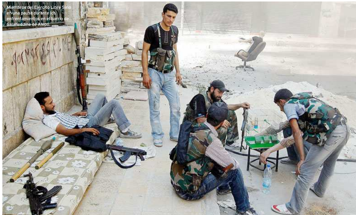
Miembros del Ejército Libre Sirio en una pausa durante los enfrentamientos en el barrio de Salaheddine de Aleppo.

DURANTE LA GUERRA DE IRAK, SOLO DEL PRINCIPAL MUSEO DE LA CAPITAL SE SUSTRAJERON 40 OBRAS MAESTRAS DE UN VALOR INCALCULABLE, DE LAS QUE HOY SE HAN PODIDO RECUPERAR 15