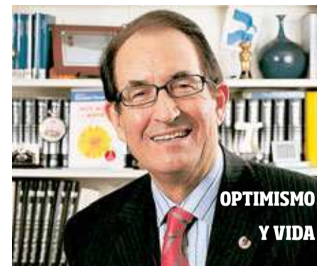
OPTIMISMO Y VIDA

Los chantajistas emocionales proliferan en todas partes y latitudes. Son los más expertos en manipular a los demás y hacerles sentirse culpables, al tiempo que utilizan constantemente el chantaje y las amenazas como arma letal